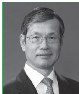
愛知県経営者協会 副会長