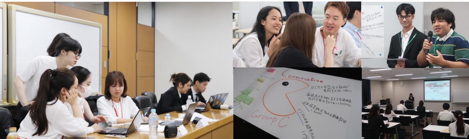
2023年度（夏季）留学生インターンシップ 及び 事前セミナー・振り返りセミナー 実施風景

※インターンシップ参加留学生を対象に、参加の心構えや注意点をレクチャーする“事前セミナー”及び学びを振り返る“振り返りセミナー”を実施しております。